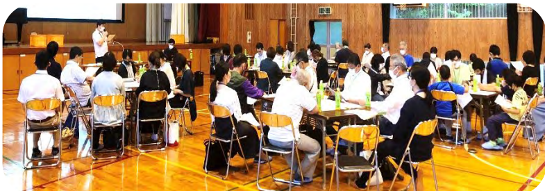
地域共生社会について学び、身近なちょっとしたお困りごとを出し合い、どう支え合いながら解決していくかを話し合った第6回策定会議。55人(うち16人は小中高高校生)が久重小体育館へ集まった。