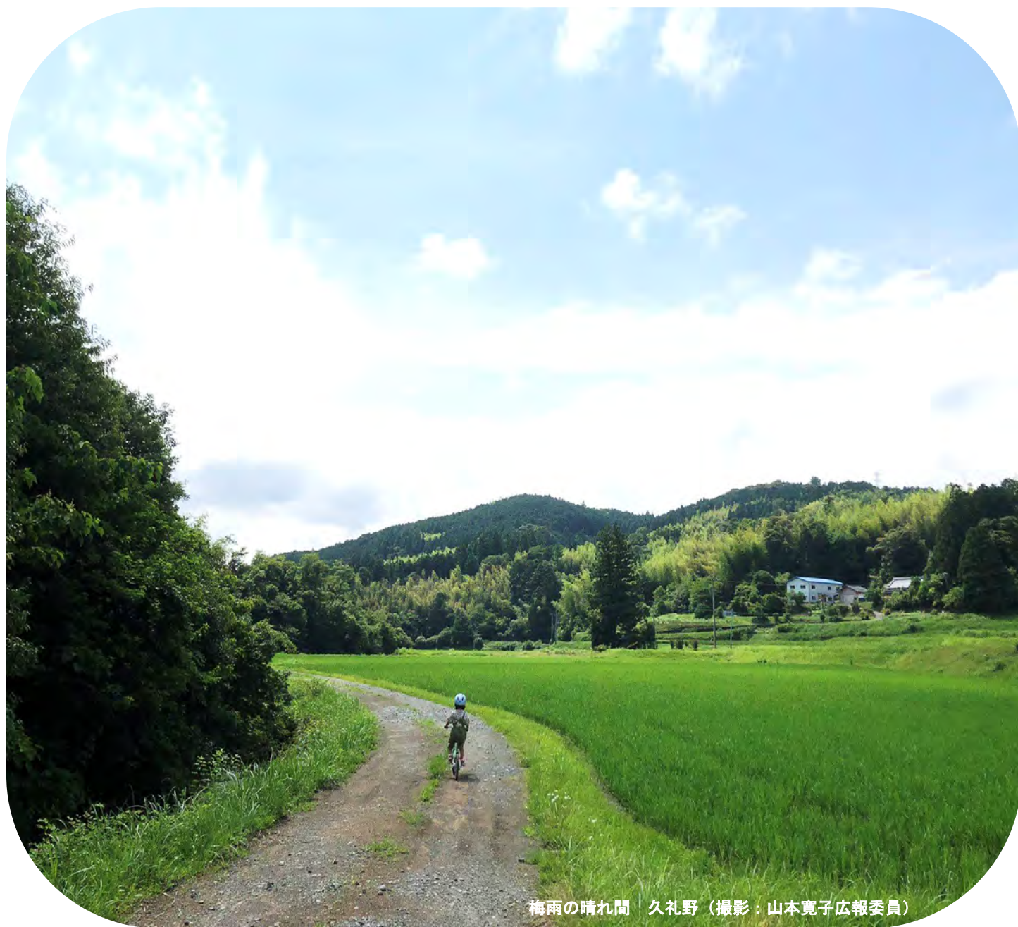
梅雨の晴れ間 久礼野

—第39号— 2022.6.25 発行 発行責任者: 林照男 編集: 広報委員会 高知市重倉 1596-134 電話: 090-4501-3190