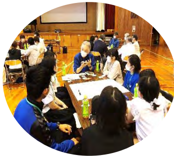
小中高生も熱心に討論