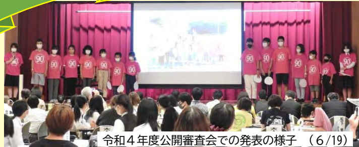
令和4年度公開審査会での発表の様子 (6/19)

今年度は、3年間の継続した活動計画を立てました。(→右) 大きな取組は久重地域での防災活動です。災害時、道が寸断され久重地域は孤立するかもしれません。そんな時、地域みんなで力を合わせて楽しく乗り越えたい...それが子どもたちの願いです。