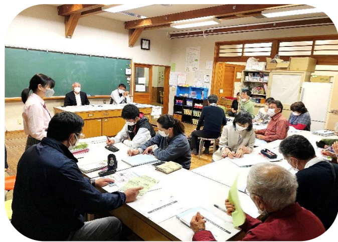
総会では、natural と youth の若者からも発言がありました。