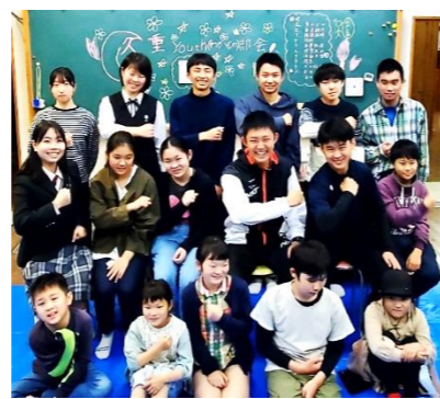
2023年4月29日 youth 集合写真

【参加者の声】「いろんな人が地域のことを考えていることがわかった」「みんなと仲良く楽しみたい」「部長をサポートしたい」「今日の会議に出られてうれしい」「これからみんなで協力していきたい」「こどもにできない時は大人の力も借してほしい」