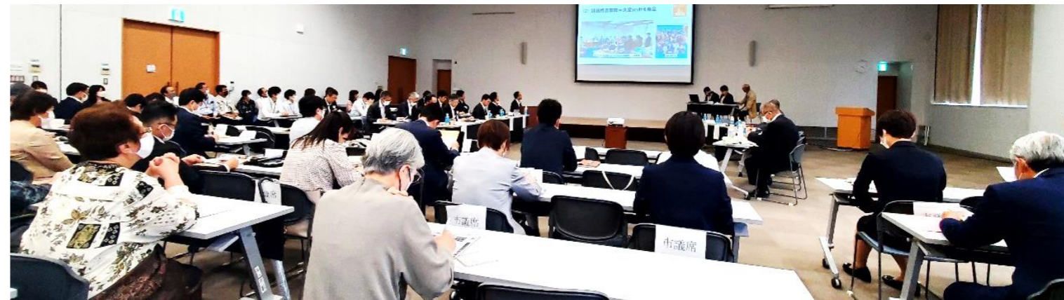
会場には、知事、市長始め県、市の幹部、県議、市議などそうそうたるメンバーが参加。