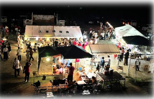
4月29日の「久重 youth 発足会」に集まったわかものや地域の人たちでカンパイ